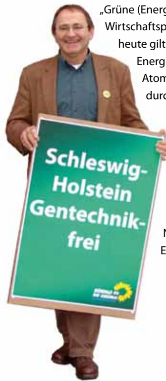
Bernd Voss, MdL Sprecher für Agrar- und Europapolitik

„Grüne (Energie-)Politik ist eine attraktive Wirtschaftspolitik, auch auf dem Land. Bis heute gilt: Das Wachstum Erneuerbarer Energie wird durch bleibende Atommonster gleich weggestrahlt und durch neue Kohlekraft ausgeräuchert.“